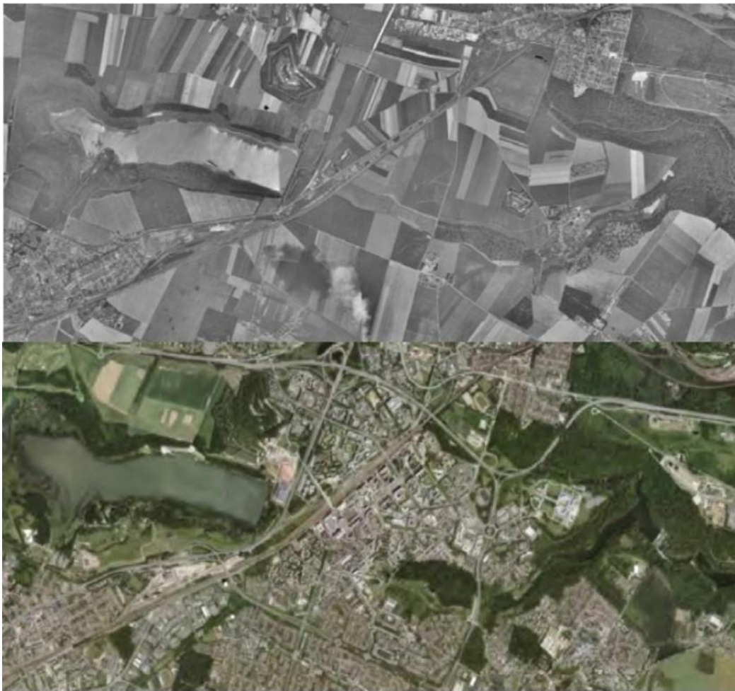
Figure 2 : SQY en 1960 et récemment

La ville avait en effet un besoin impérieux d'exutoires pour les eaux de ruissellement supplémentaires engendrées par l'urbanisation massive.