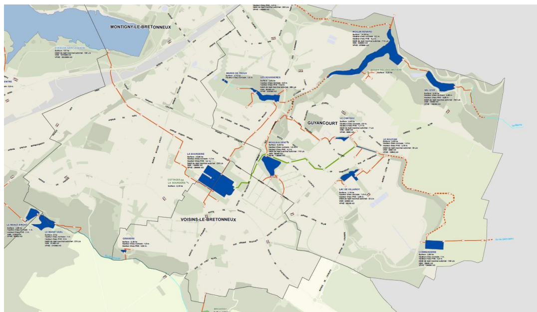
Figure 3 : Acheminement des eaux de ruissellement de SQY est 2020

En direct par l'amont de la source naturelle à Bouviers et en utilisant le réseau interne de la ville pour acheminer l'eau dans la Bièvre au niveau de Jouy-en-Josas via une canalisation entre le bassin de la Commanderie à l'extrémité est de la ville et le ru de St Marc.