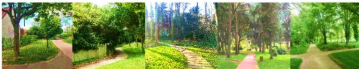
Parc Heller, Antony

Le marché sera publié en mai 2021 et des prestataires seront retenus pour réaliser les études de faisabilité dès juillet 2021 par la Métropole du Grand Paris.