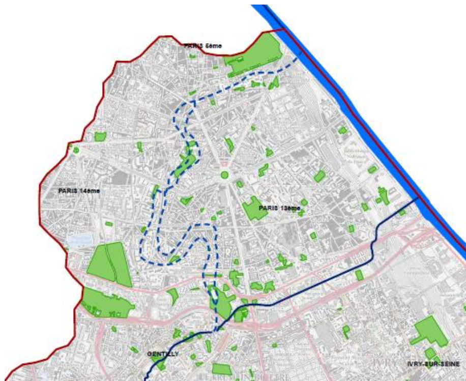
Tracé historique de la Bièvre dans Paris

Son lit majeur est entièrement occupé par l'urbanisation. A Paris, la Bièvre a perdu toute réalité propre à la suite de remblaiements et d'opérations d'urbanisme.